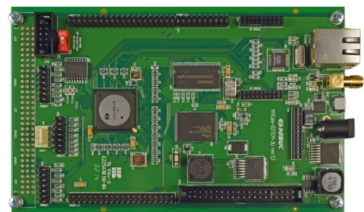
Модуль отладочный NVCom-02TEM-3U

DSP-кластер имеет ряд новых возможностей: набор графических команд, аппаратный ускоритель кодера Хаффмана; возможность отработки DSP-ядрами внешних прерываний; возможность доступа DSP-ядер к внешнему адресному пространству; гибкая граница программной памяти кластера DSP; прерывания от исключительных ситуаций при операциях с числами с плавающей запятой.